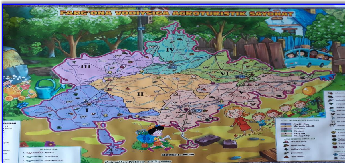
1-расм. “Фарғона водийсига агротуристтик саёҳат” деворий кўрғазма стенди

Замонавий информацион педагогик технологиялар асосида тайёрланган “Фарғона водийсига болажонларнинг агротуристтик саёҳати” кўрғазмали стендини (1-расм) МТТда қўллаш орқали болажонларни ватанпарварлик руҳида тарбиялаш ҳамда уларнинг ўз кичик ватанлари бўйича тегишли билим ва кўникмаларини шакллантириш мумкин. Стендда Фарғона водийси ўзига хос 5 та агротуристтик районларга ажратилган бўлиб, унда ҳар бир районнинг болажонларни ватанпарварлик руҳида тарбиялашга қаратилган туристик объектлари, маросимлари ва агротурлар акс эттирилган. Унинг энг оптимал катталиги 1x2 метр форматда, рангли тасвирда ва туристик объектлар 3 хил рангдаги чироқларда акс эттирилади.